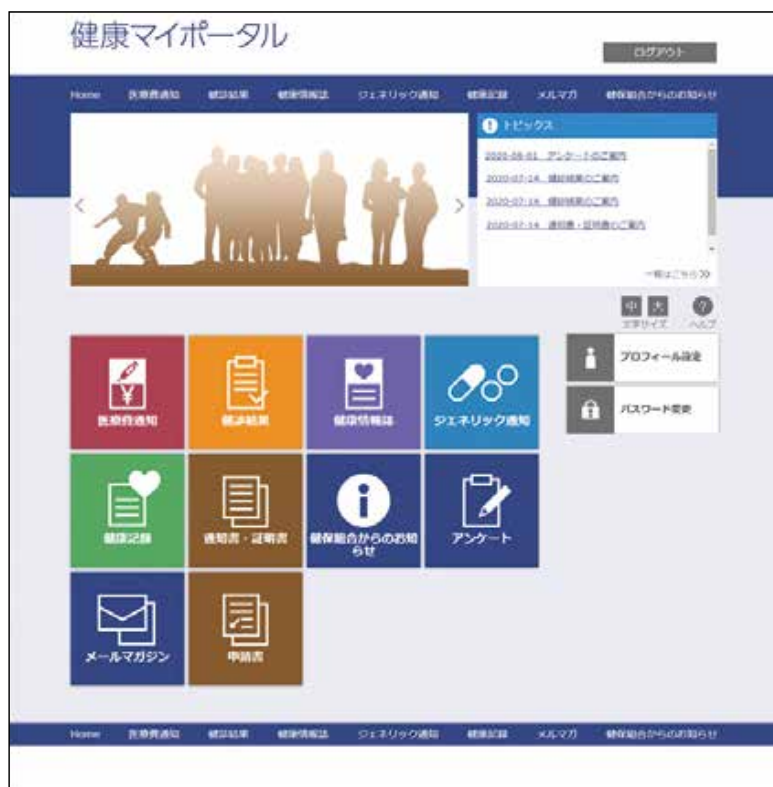
◀「健康マイポータル」画面イメージ

当健保組合では、加入者の皆様の利便性向上のため、一人ひとりの専用ウェブサイト「健康マイポータル」を開設(令和5年夏頃を予定)いたします。