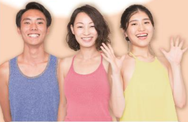
LAVAヨガインストラクター